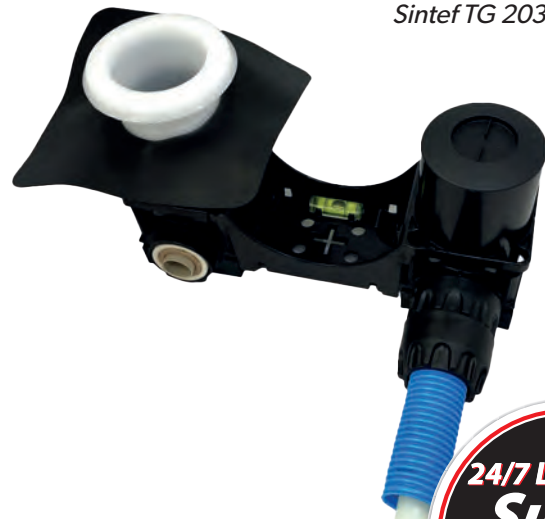
Hanakulmarasia pistoliittimellä, Sintef TG 2035 hyväksyntä